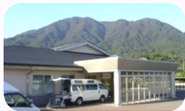
地域リハビリセンター「ぬくもりの里」

地域リハビリセンター「ぬくもりの里」と地域リハビリセンター「あいあい」では、介護や支援が必要な方お一人おひとりの状態に応じたきめ細かな介護やリハビリ（機能訓練）、さまざまな自立訓練活動などのサービスを提供しています。