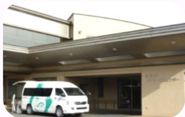
地域リハビリセンター「あいあい」